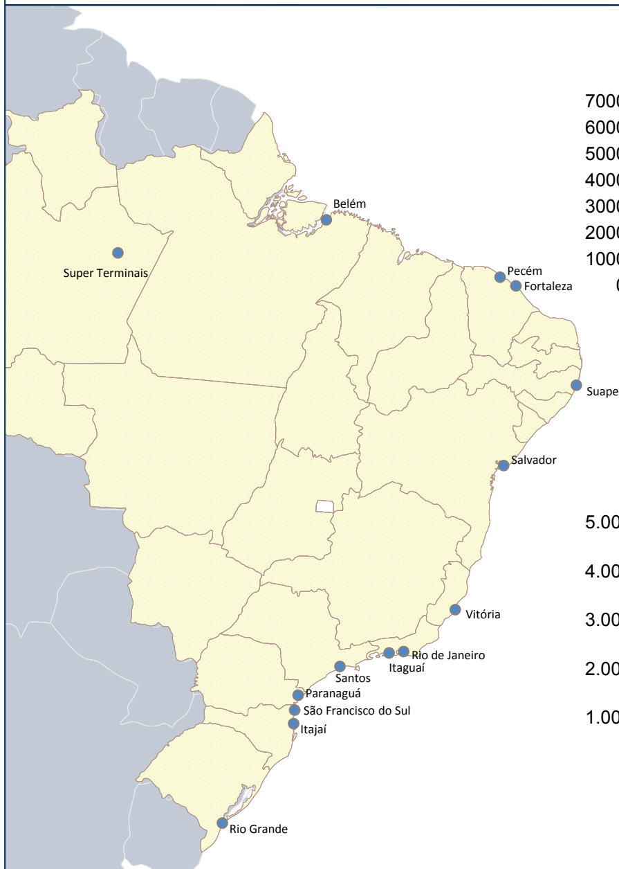
TEUs movimentados e o acumulado em 2007 (x1000)